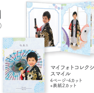
マイフォトコレクション スマイル 4ページ・4カット +表紙2カット