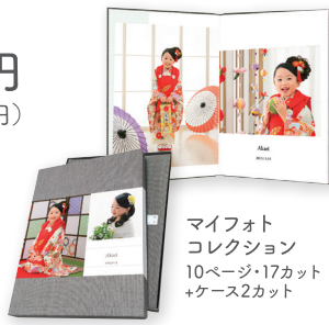
マイフォト コレクション 10ページ・17カット +ケース2カット