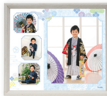
BOXフレームデザインフォト 4カット