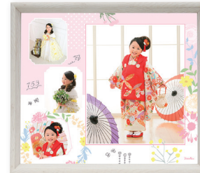
BOXフレームデザインフォト 4カット