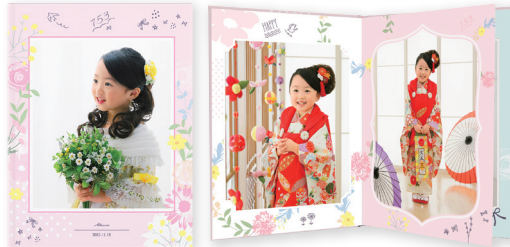
マイフォトコレクション スマイル 4ページ・4カット+表紙2カット