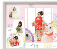
BOXフレーム デザインフォト 4カット